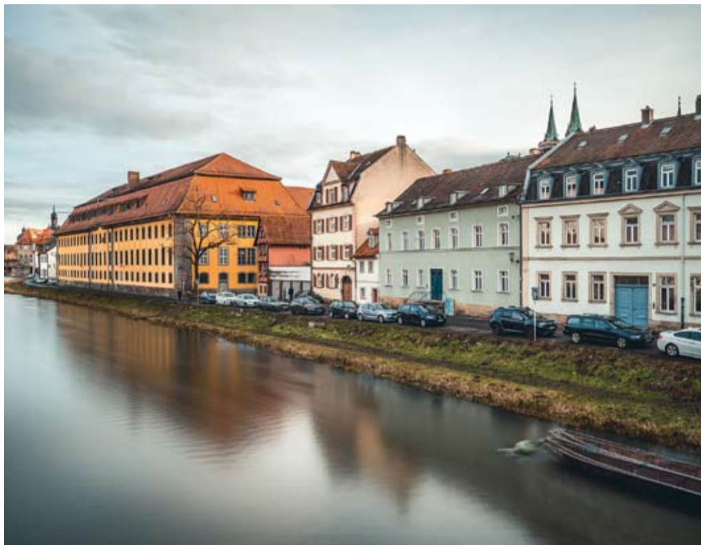
Der Leinritt gehört - abgesehen von der JVA - zu den beliebtesten Wohnlagen im Sand.

Silke Klotzek Sachgebietsleiterin Stadtsanierung / Stadtgestaltung im Stadtplanungsamt Bamberg