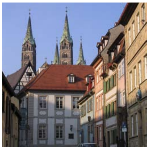
Übernachten zu Fuß des Kaiserdoms

Eines der wohl schönsten Hotels in Bamberg ist das Palais Schrottenberg im Sand. Die ehemalige Residenz der Freiherren von Schrottenberg ist ein barockes Palais, das 1710 errichtet wurde. Die Planung der zweigeschossigen Dreiflügelanlage mit Innenhof übernahm vermutlich Johann Dientzenhofer. Das Palais wurde von der Familie von Schrottenberg bis 1919 bewohnt. Nach mehreren Besitzerwechseln richtete 1928 der bereits in der Dominikanerstraße 10 ansässige Ambros Mahr in einem Seitenflügel eine Schnaps- und Likörfabrik ein. 1960 erwarb Familie Kaczmarek, die Eltern der heutigen Besitzerin, das Palais.