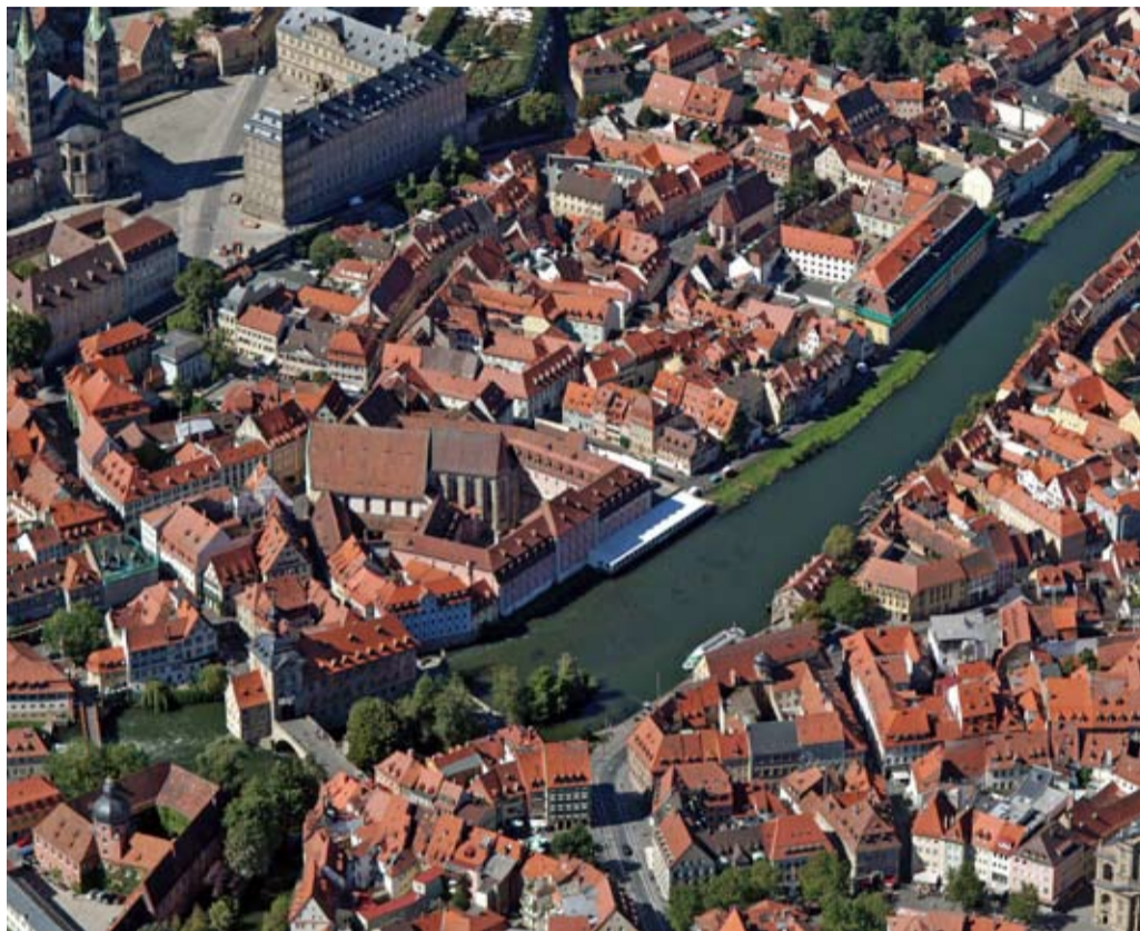
Bambergs ältester Stadtteil aus der Luft betrachtet