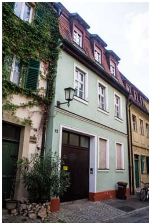
Schlichtes Haus mit exotisch klingendem Namen