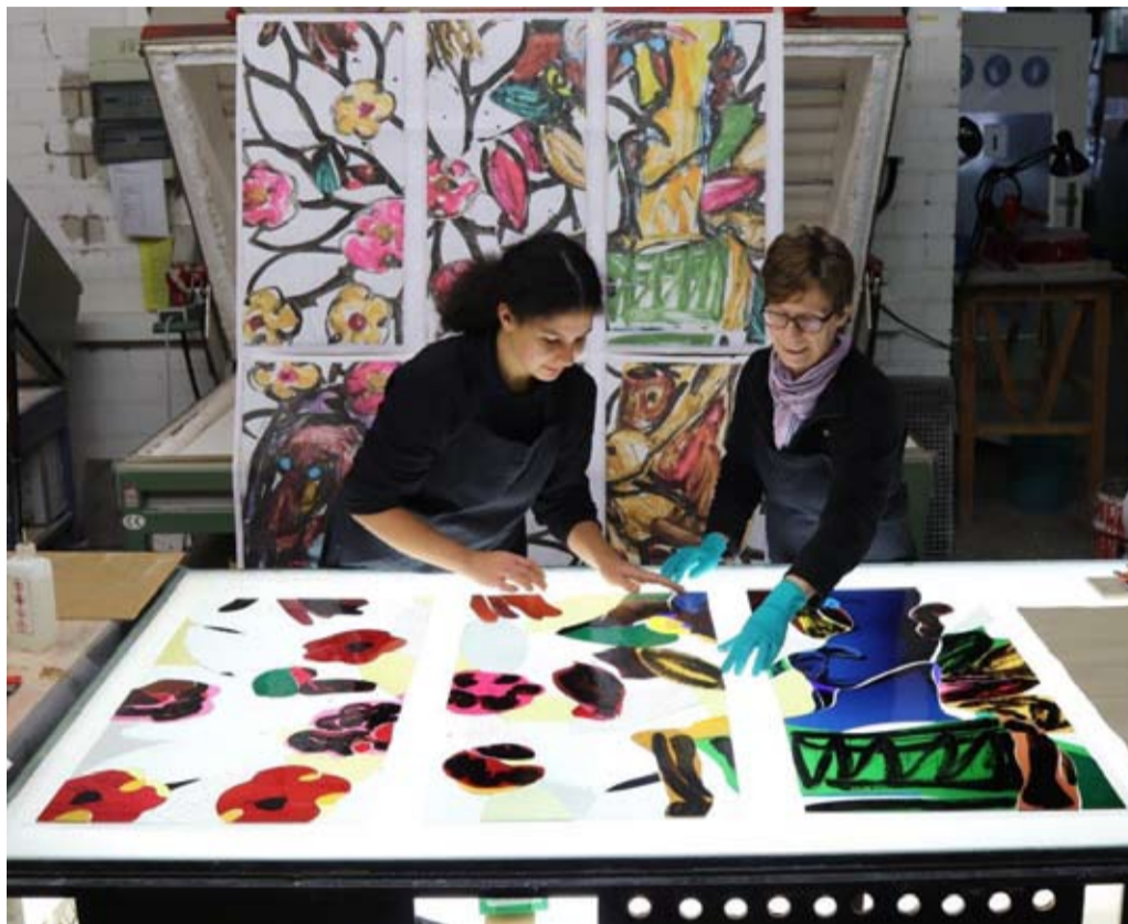
Das erste Lüpertzfenster für St. Elisabeth wird zur Zeit in den Derix Glastudios angefertigt.

Christoph Gatz Initiative Lüpertzfenster für St. Elisabeth