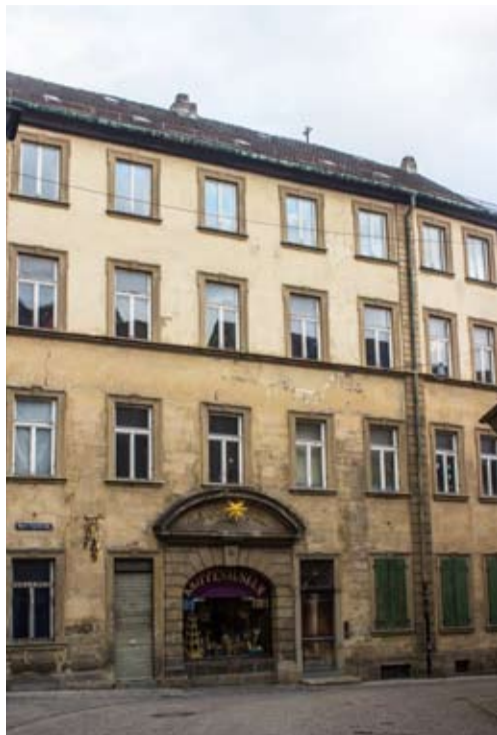
Das viergeschossige Haus beherbergt heute u.a. das Krippenmuseum.